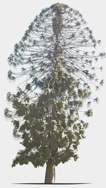
19 Araucaria bidwilli