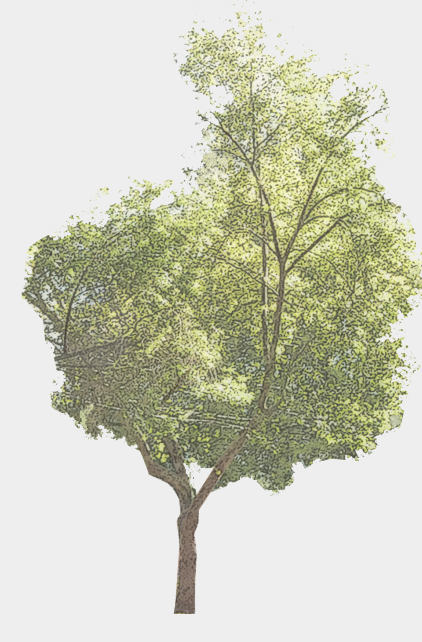
20 Plátano Oriental